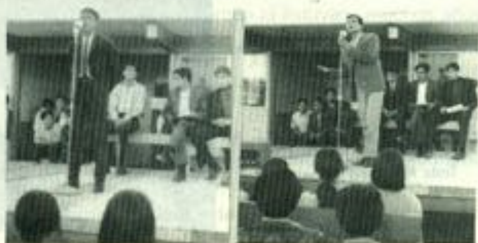
En eventos culturales en las escuelas de la Universidad.

De esta etapa no pudo expresar muchas cosas, es poco el recuerdo que tengo de esto, pero hubo interesantes logros, creo que el consiguió a reserva de que me lo aclaren, las canchas de los deportivos a un lado de las prepas, no sé si más terreno o algo gestionó para la Facultad de Medicina. Siempre fue muy inquieto y trabajador desde ese entonces.