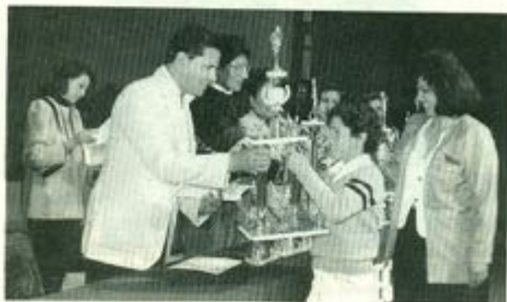
Premiación a triunfadores en eventos deportivos.

¿Qué mensaje le darías a la FEUD, a reserva de ampliarlo?