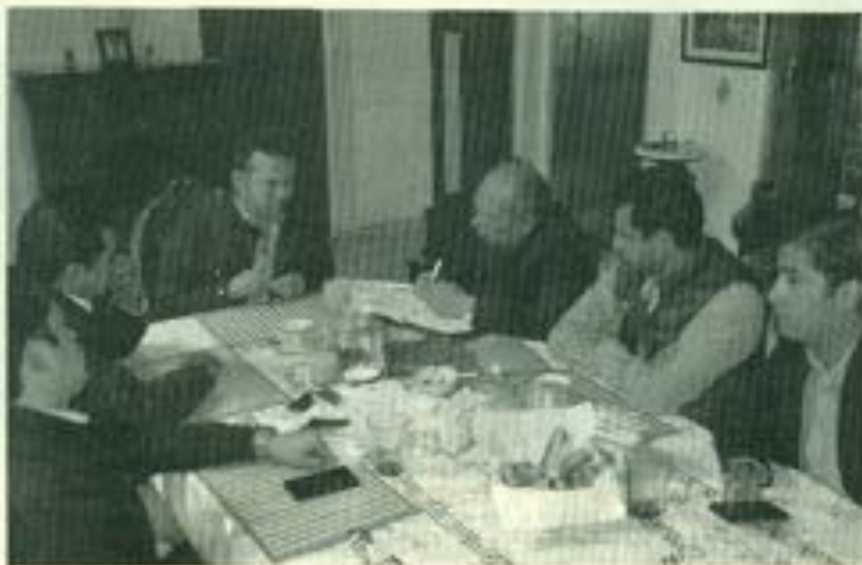
Convivio de ex presidentes de la FEUD en la casa del autor.