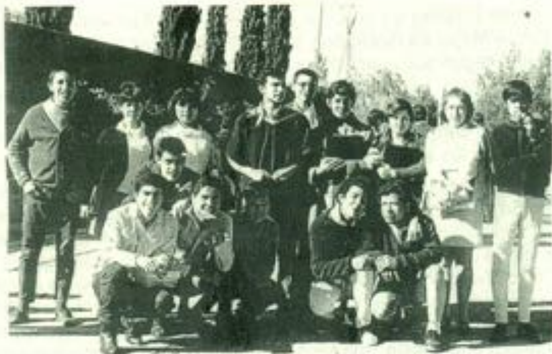
Jubilosos preparatorianos con el nuevo Presidente de la FEUD.