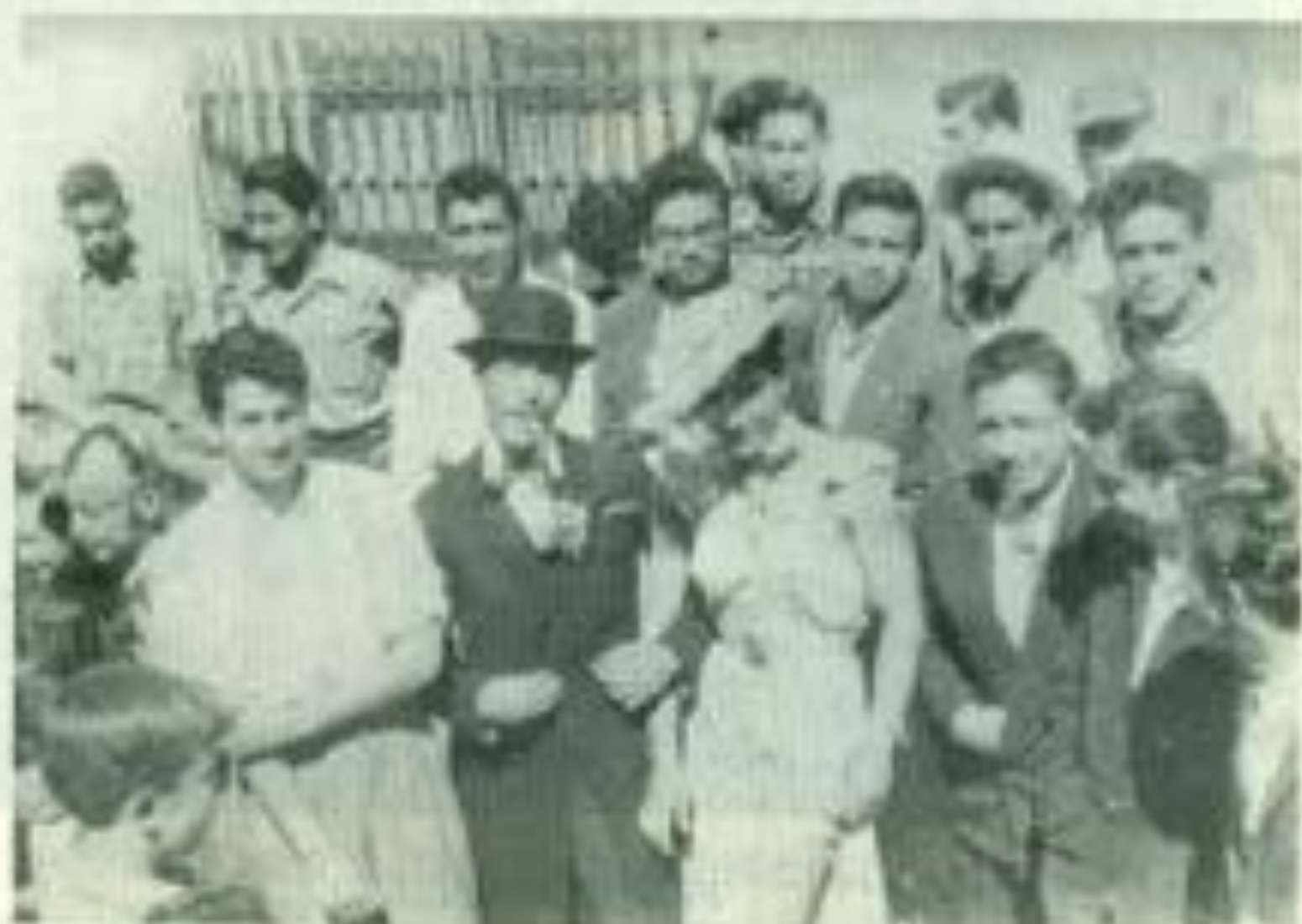
Burlesque del Centenario del Instituto Juárez