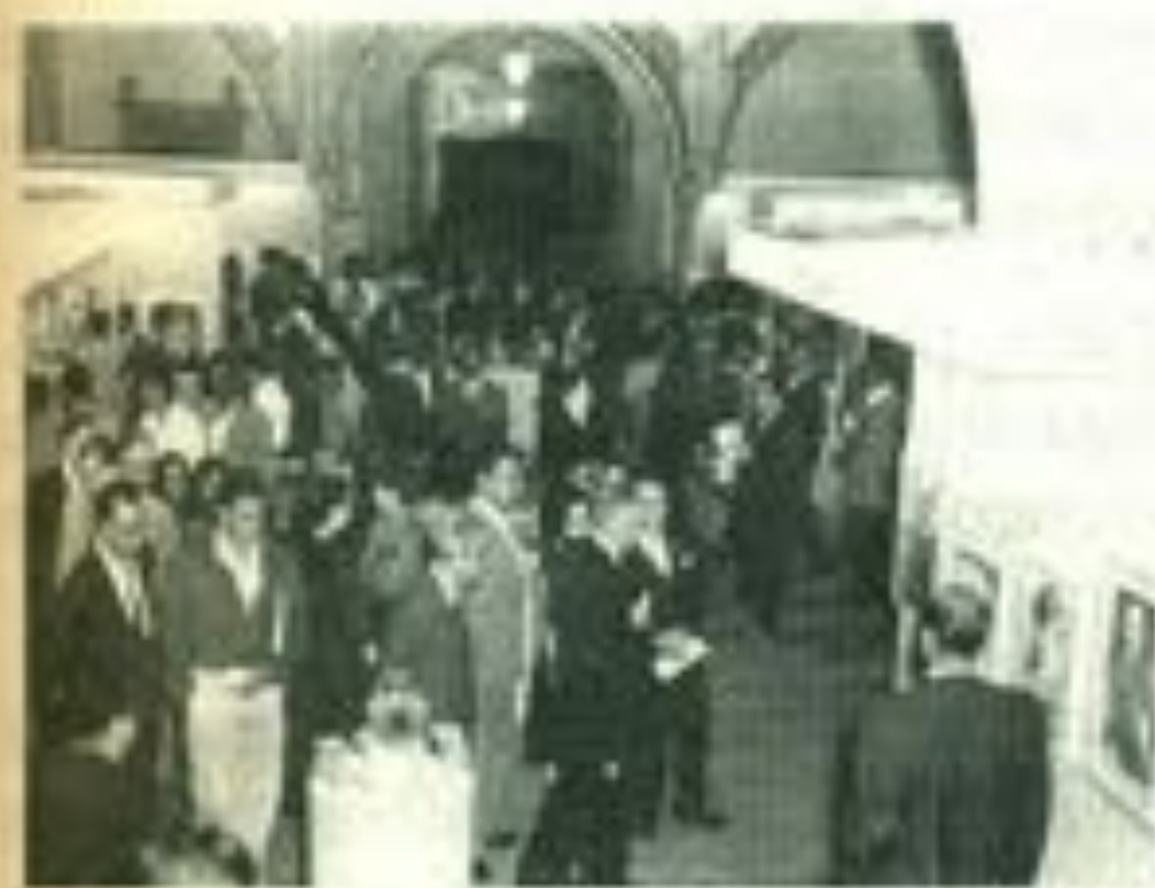
Exposición de pintura en el Central