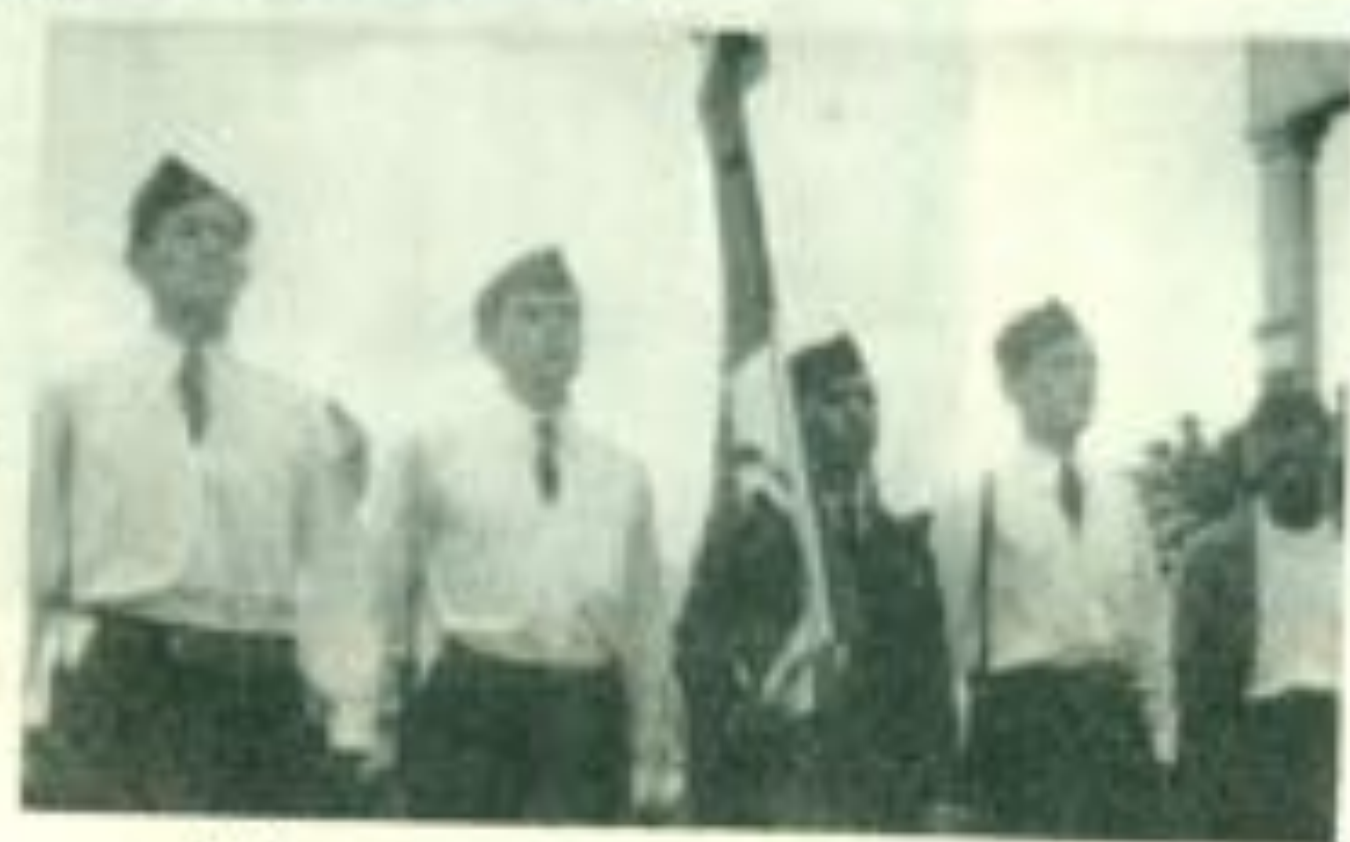
Abanderado de la escolta del Instituto Juárez, Agustín Ruiz Soto, a la postre dos veces diputado federal y senador de la República.