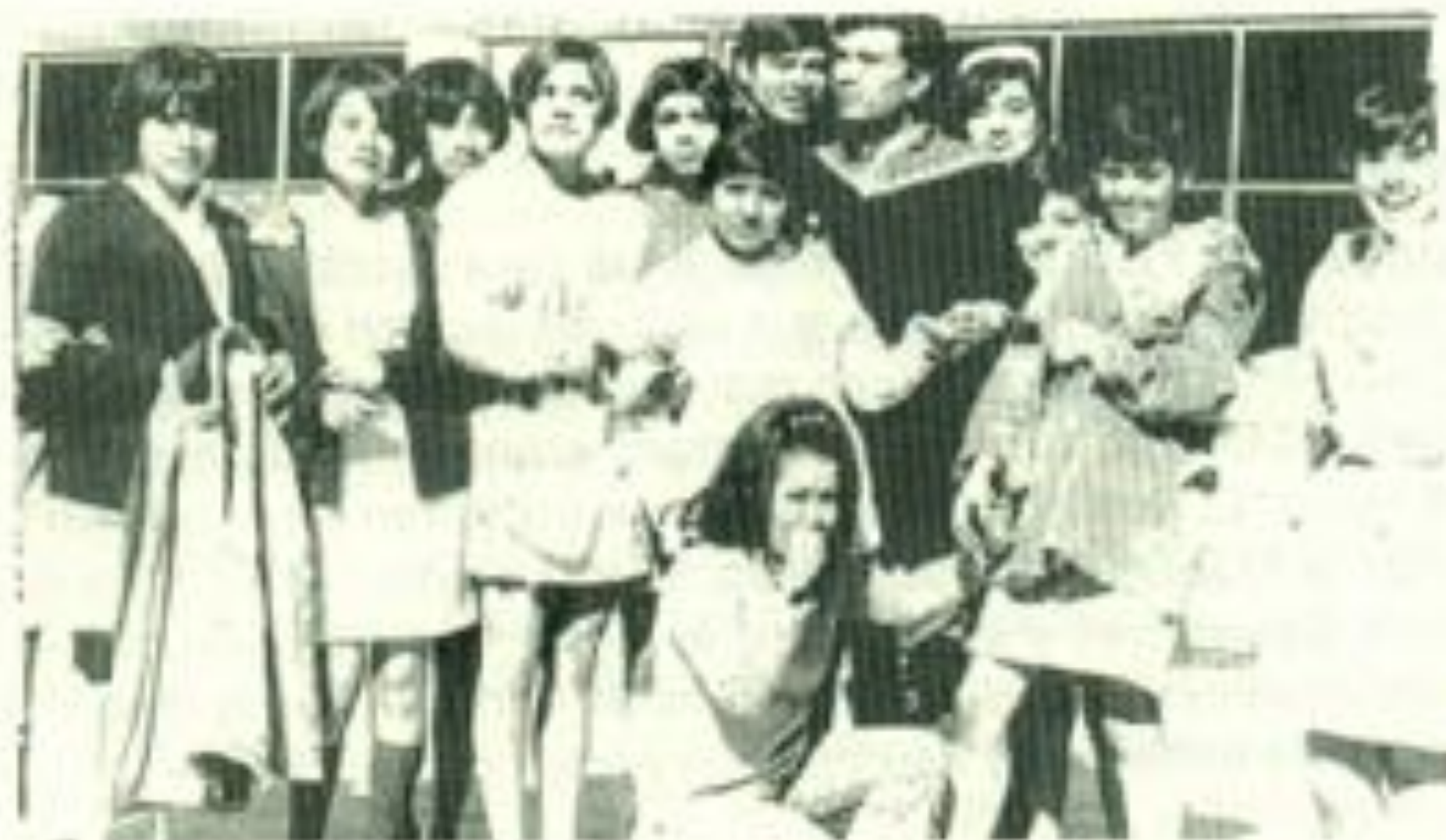
Celebrando la victoria de la Planilla Azul de la FEUD.