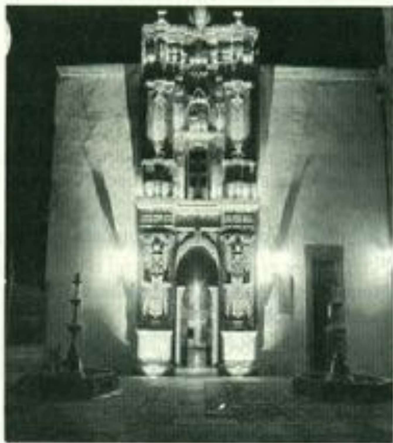
Vista nocturna del Frontispicio del Edificio Central de la UJED