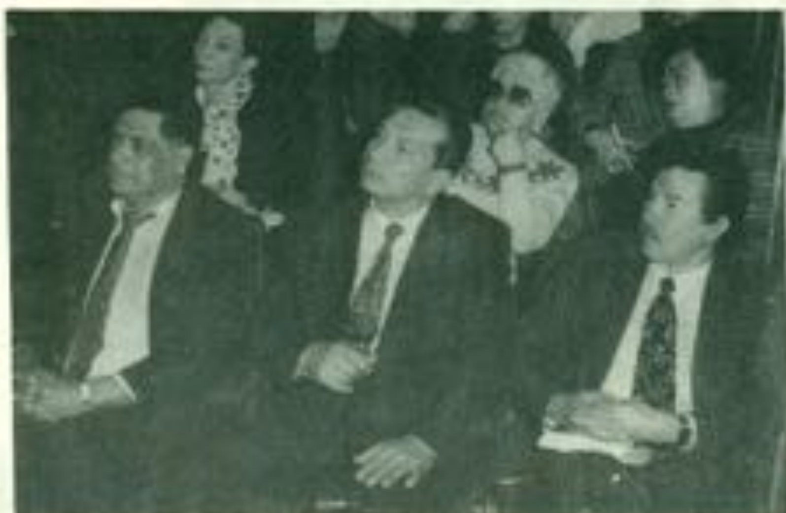
Tres ex presidentes de la FEUD de los años 60s.