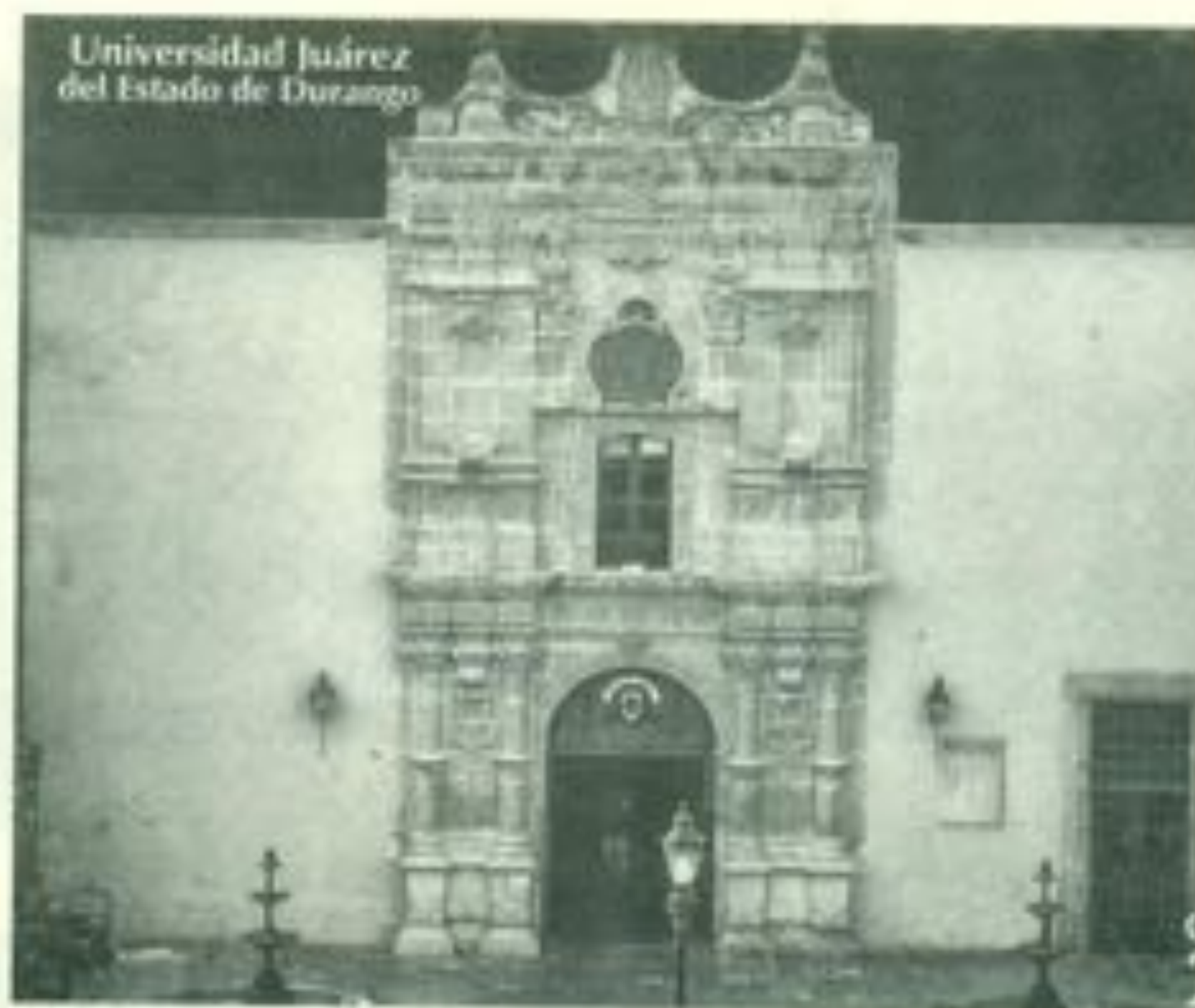
Histórico frontispicio en una vista nocturna en la que luce a todo su esplendor.