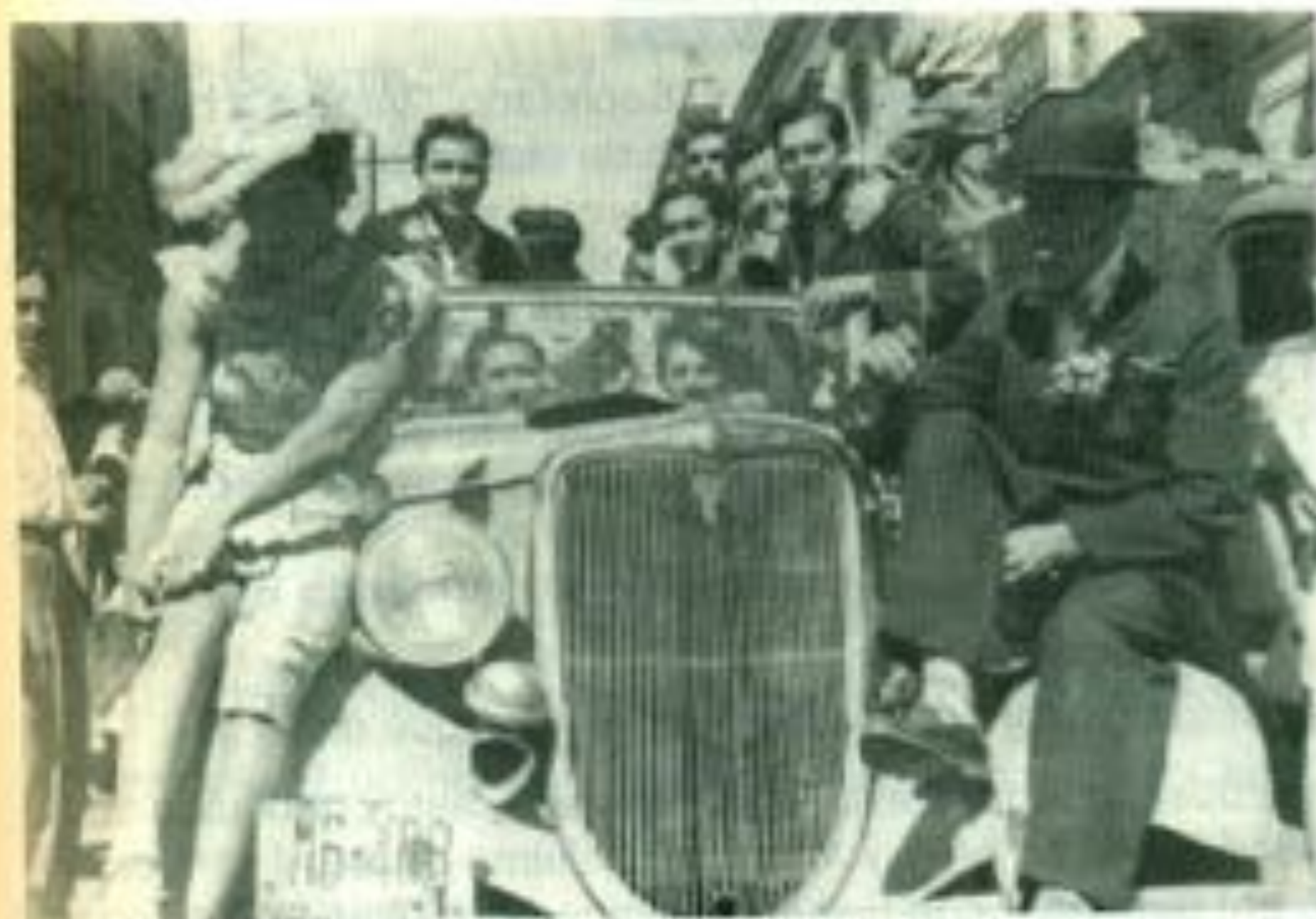
Desfile con el que se anunciaba el burlesque de 1954

hacia poquito menos de 12, y yo, eso en la tierra, con altos y bajos pues cual pista, en el viejo Estadio de Beisbol.