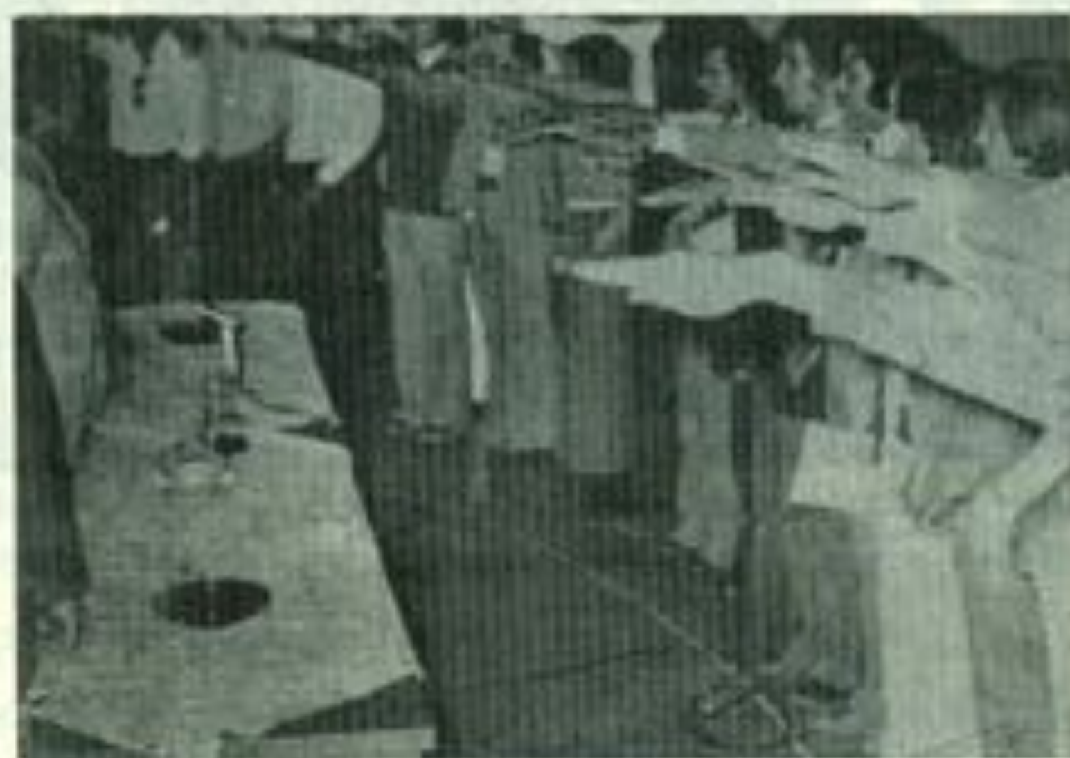
En la toma de protesta de la FEUD 1975-1976.