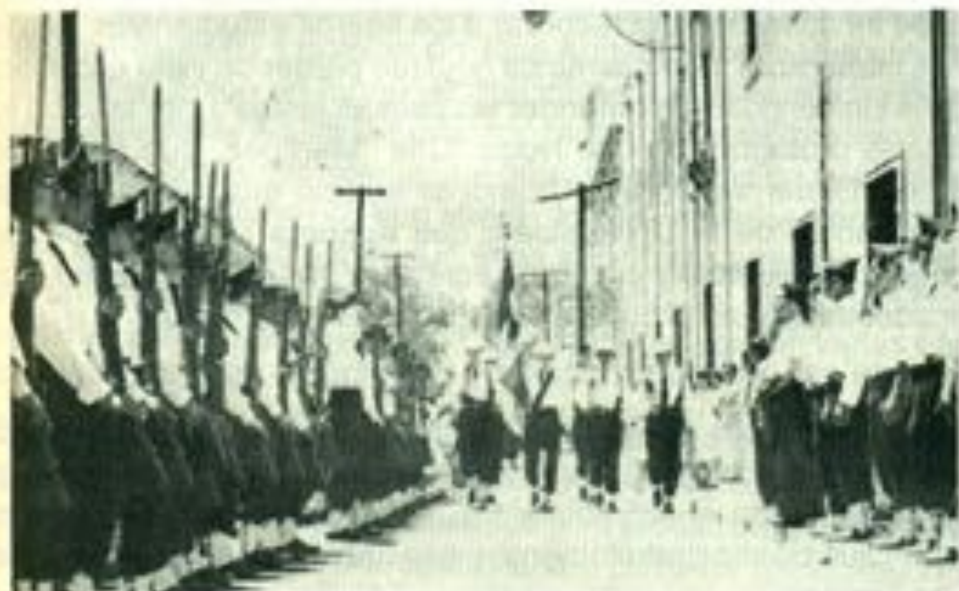
Honores a la bandera a un costado del Edificio Central por estudiantes del Instituto Juárez

-Sí, al ver la reacción de muchos universitarios la volvieron a colocar unos metros más al norte, para dar cabida a una fuentecita cantarina que de ninguna manera es una obra artística e incluso no creo que el INAH lo haya autorizado y se habló que el rector de entonces y el gobernador hayan tenido algún acuerdo sobre otra ubicación, de ese histórico monumento, lo cual no