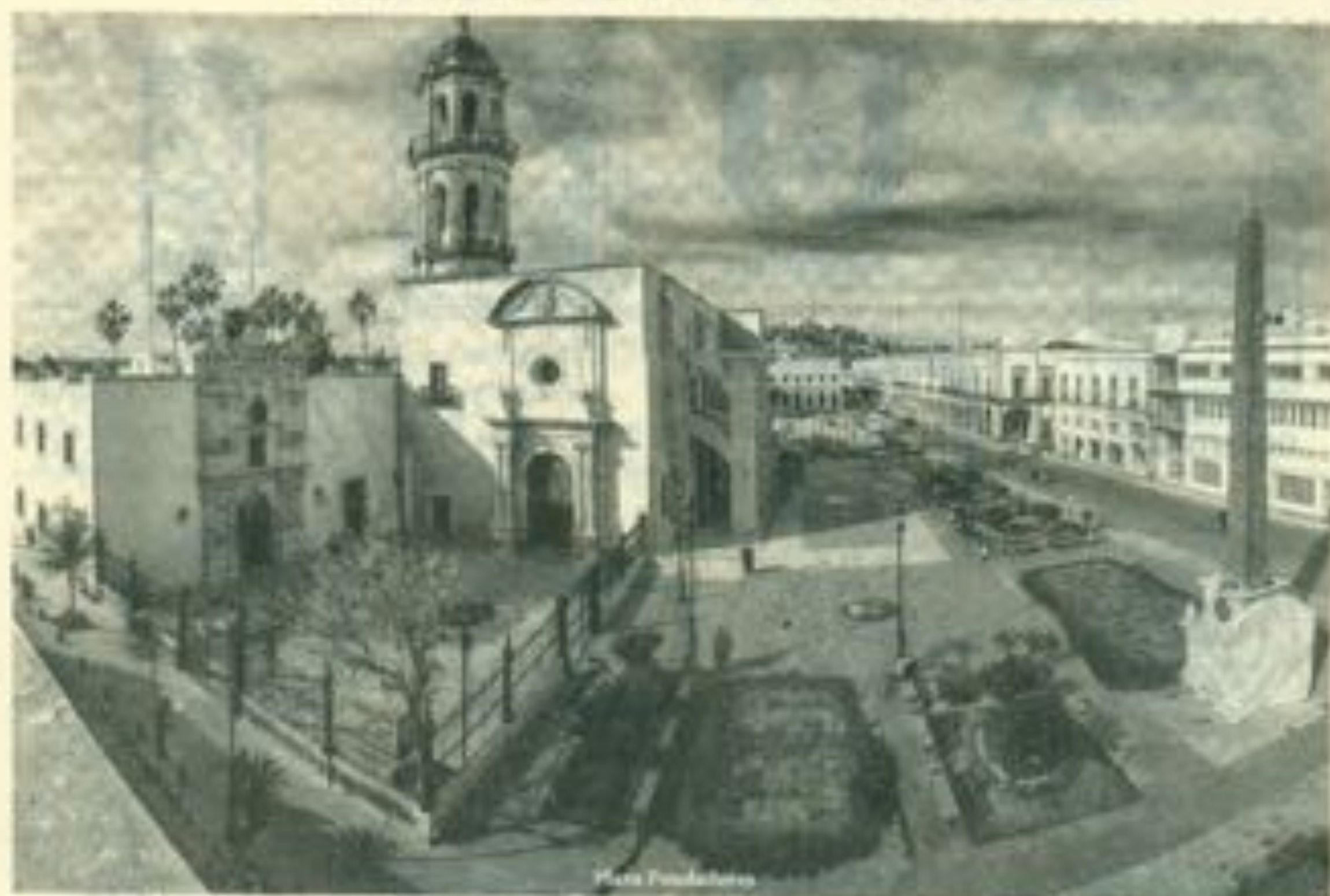
Vista panorámica del Edificio Central y la Iglesia de San Juanita de los Lagos, recuperada con la Plaza de los Fundadores.