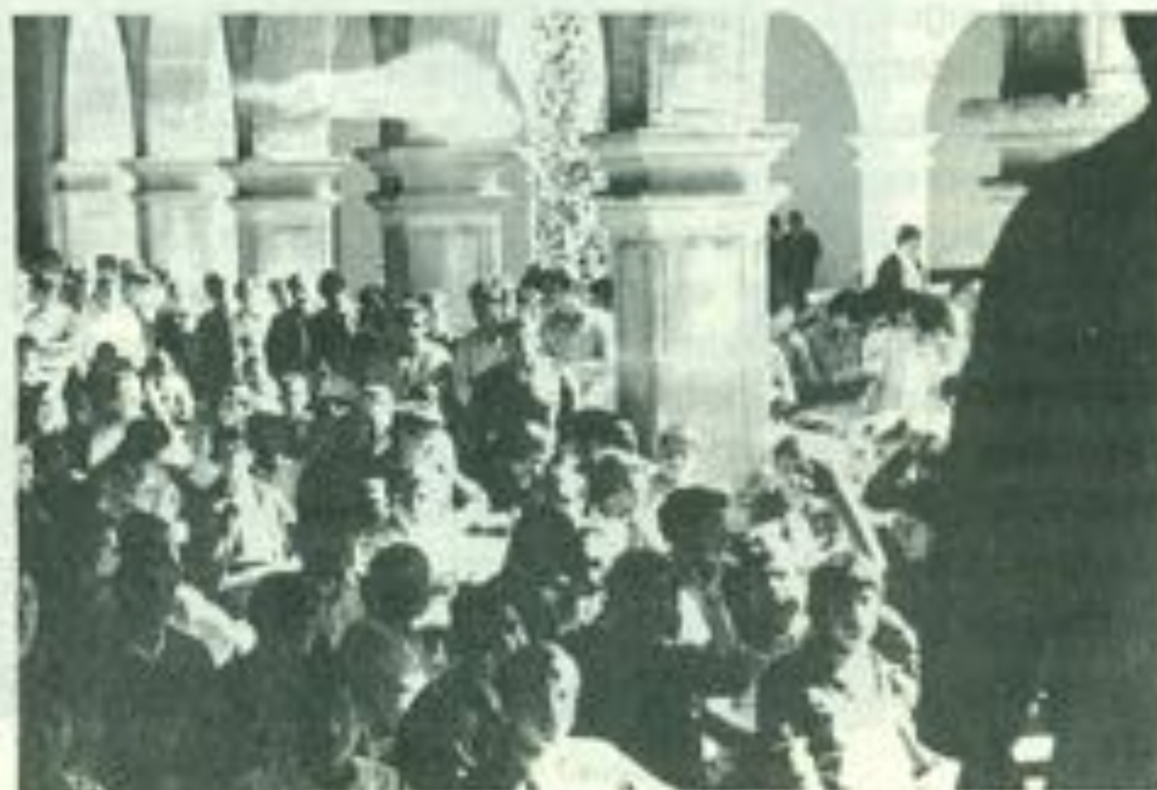
Los pasillos del Edificio Central han sido el marco de asambleas estudiantiles, concursos de oratoria y de declamación.