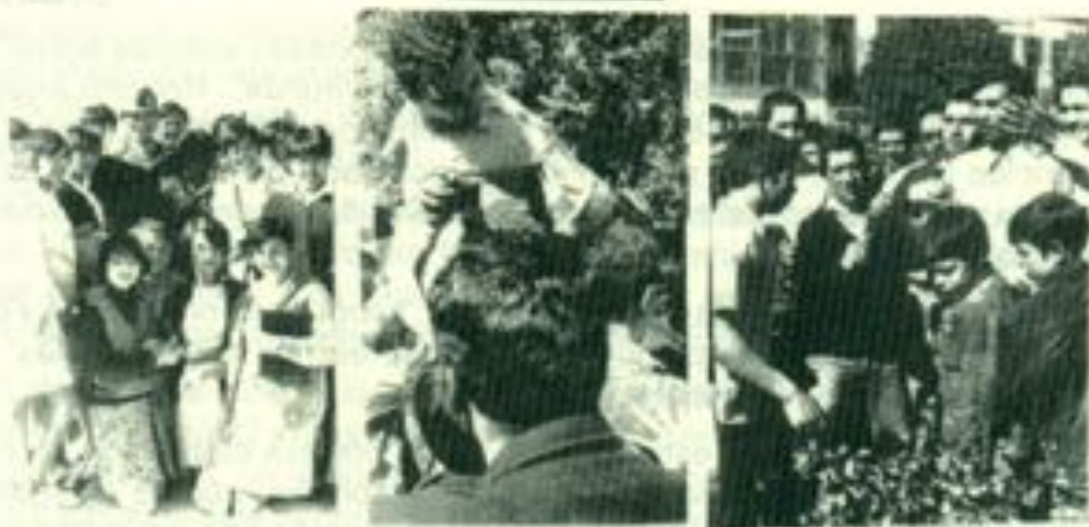
Cuando se ganó la Comercial Práctica y en el tradicional baño del triunfo en la Plaza de Armas.