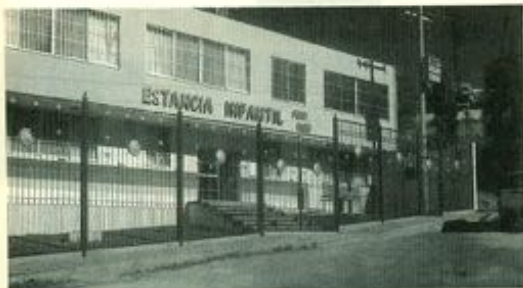
Con edificio propio cuenta la Guardería Universitaria, pionera en el país.