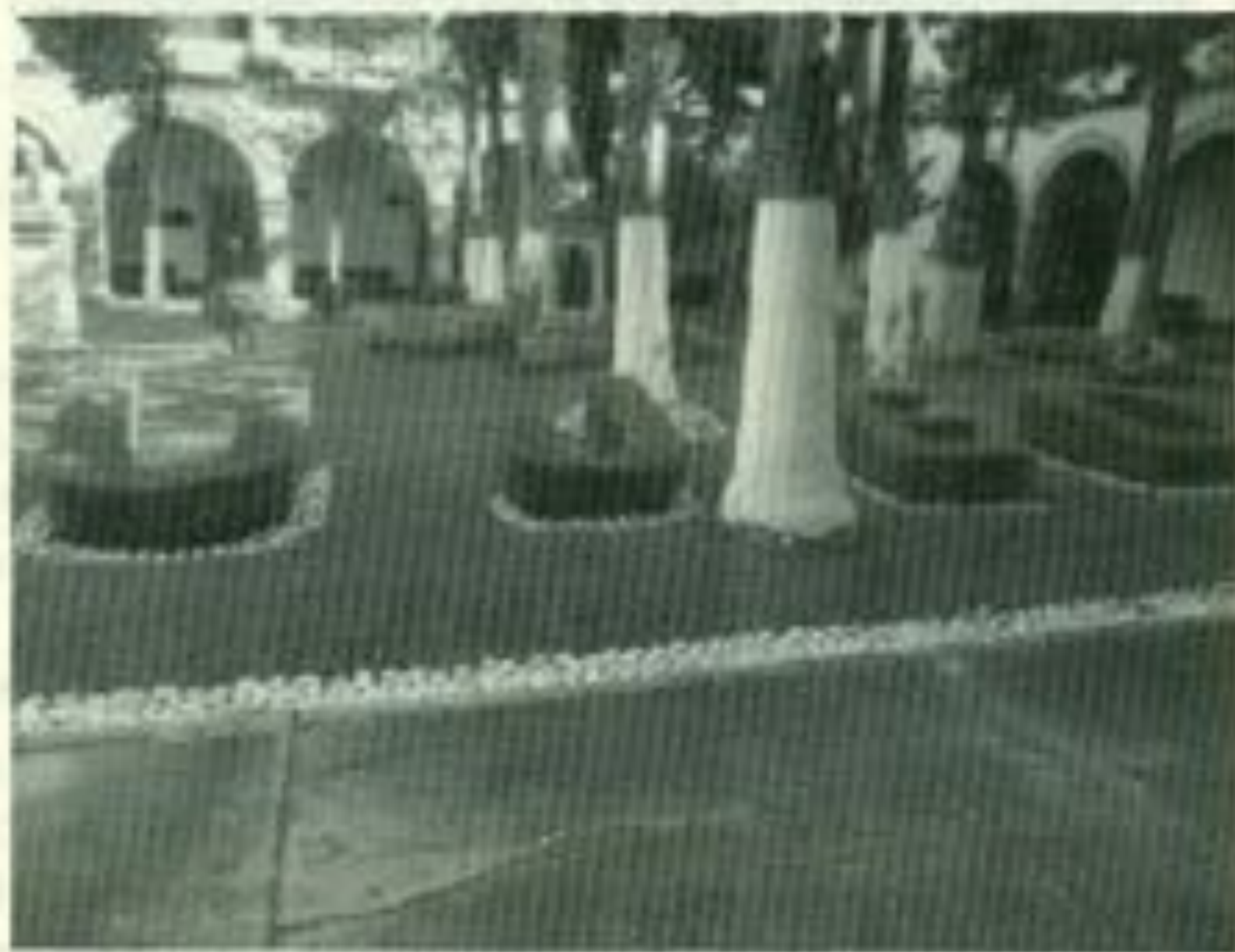
Hermosos jardines interiores del Edificio Central de la UJED.

Los dedos de mi mano teclean, lo que mi cerebro les ordena, pero mi corazón es el que siente. Recuerdo a una FEUD beligerante, aunque no estaba legitimada por el voto estudiantil, actuaba a nombre de ella queriendo ser presión a favor de una de las partes. Nadie creía en su imparcialidad.