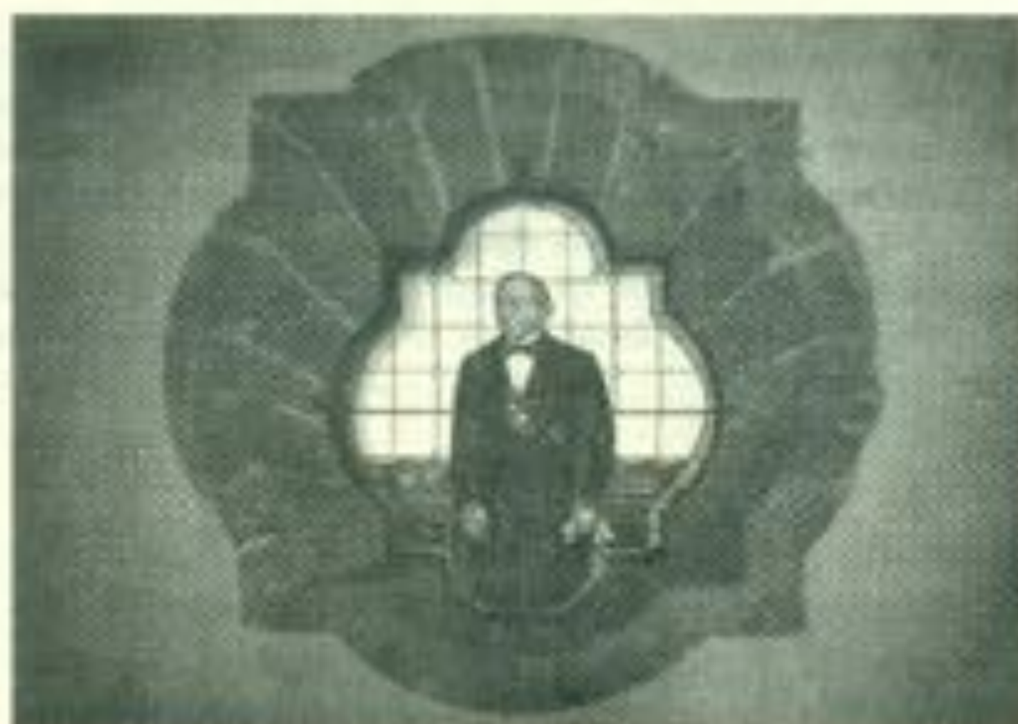
Hermoso y legendario vitral de quien lleva su nombre la Universidad Juárez.