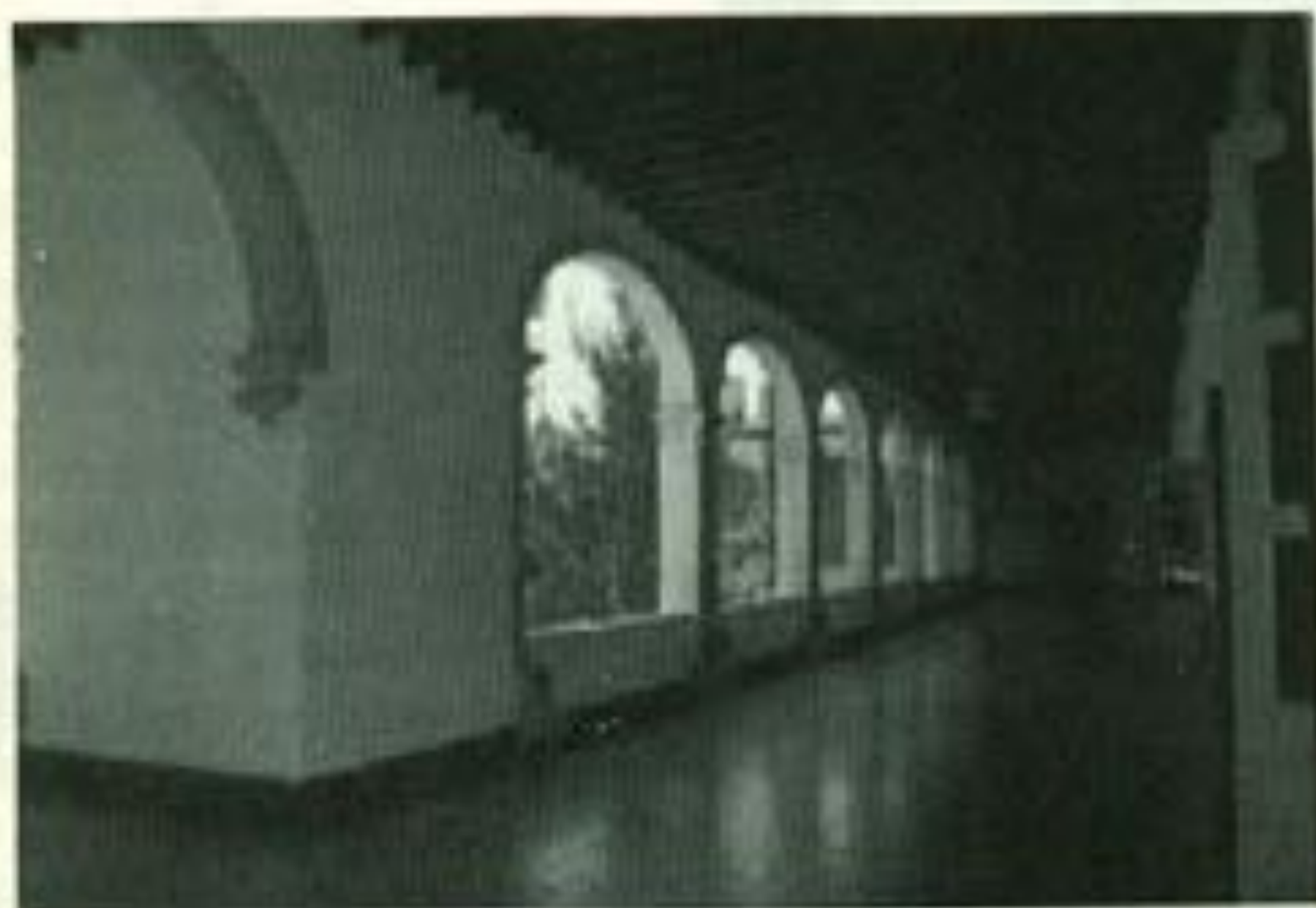
Pasillos de la UJED.