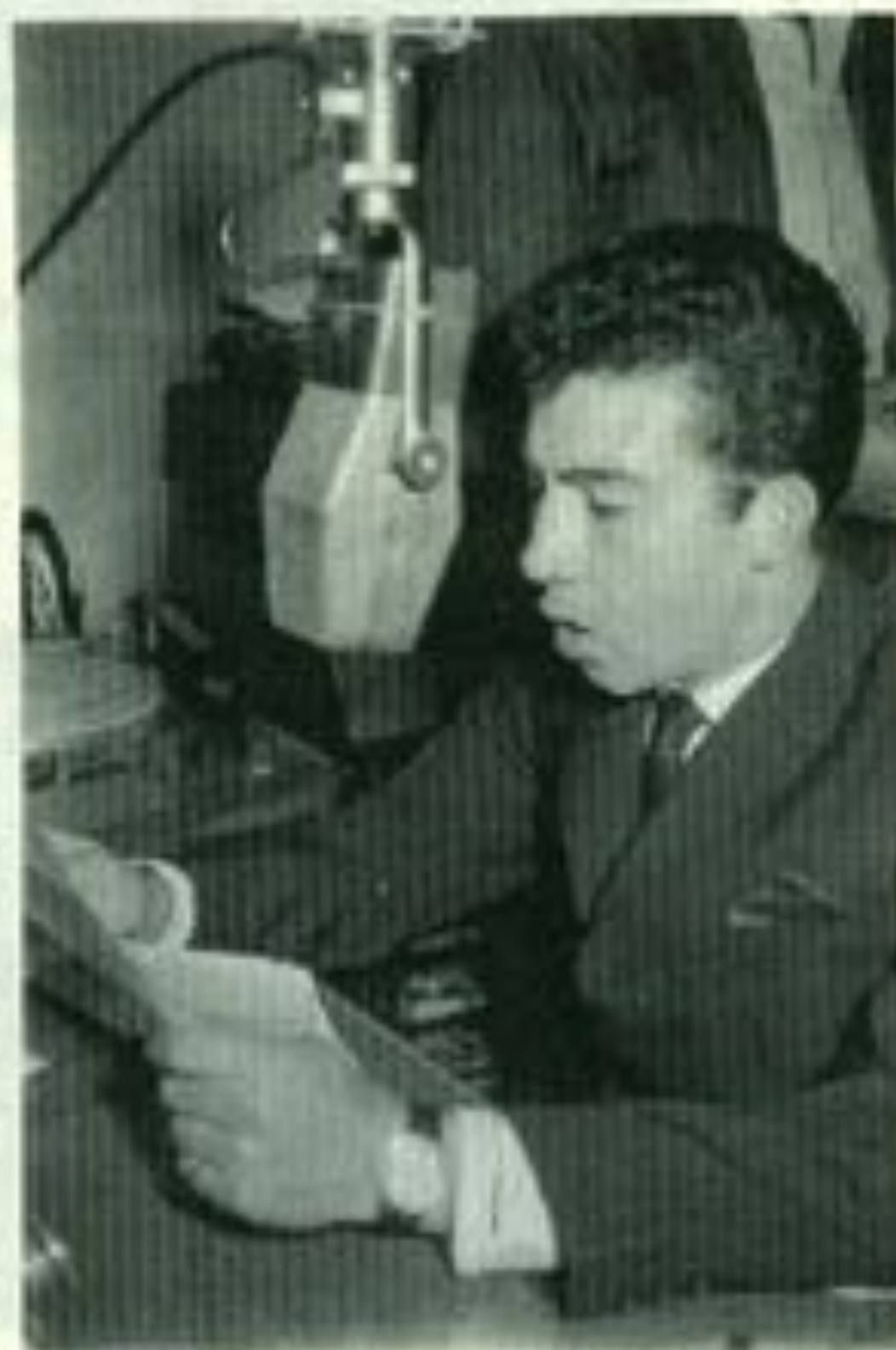
En la Hora Universitaria.

¿Cómo se concibió la idea de la toma del Cerro del Mercado y quiénes participaron?