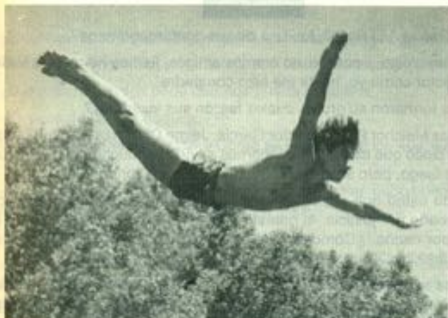
En la alberca olímpica desde el trampolín de 10 metros

¿Era usted estudiante y celador? Compártanos por favor maestro, del tesoro de sus recuerdos. ¿Qué más nos comenta?