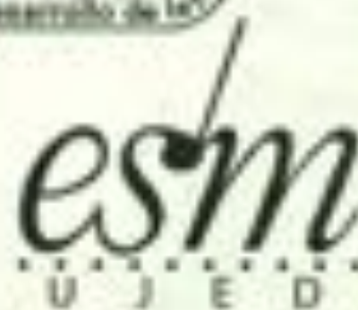
FACULTAD DE AGRICULTURA Y ZOOTECNIA