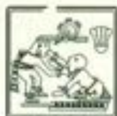
ESCUELA DE ODONTOLOGÍA