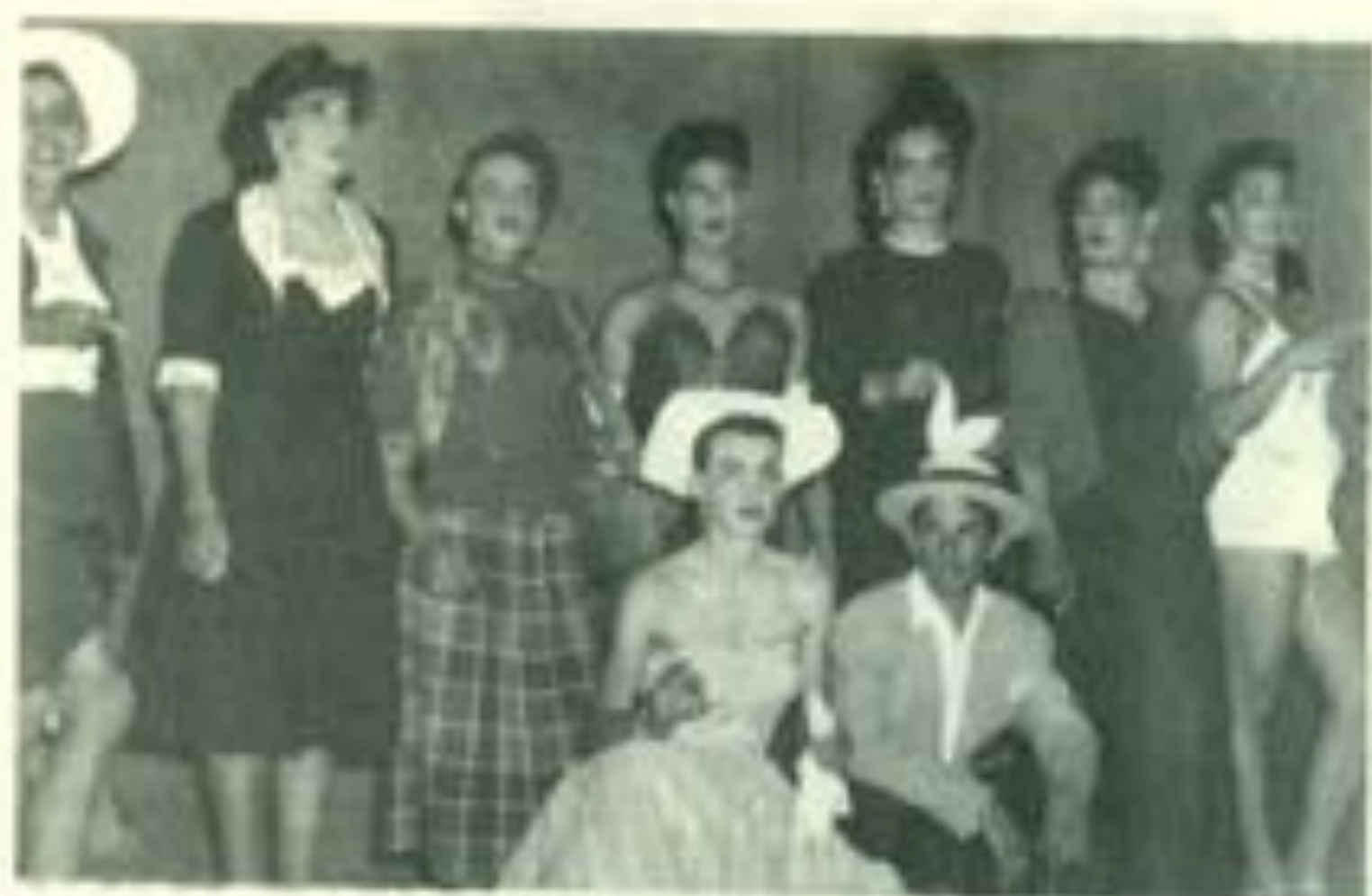
Los jocosos burlesques eran el marco para el juego de disfraces.