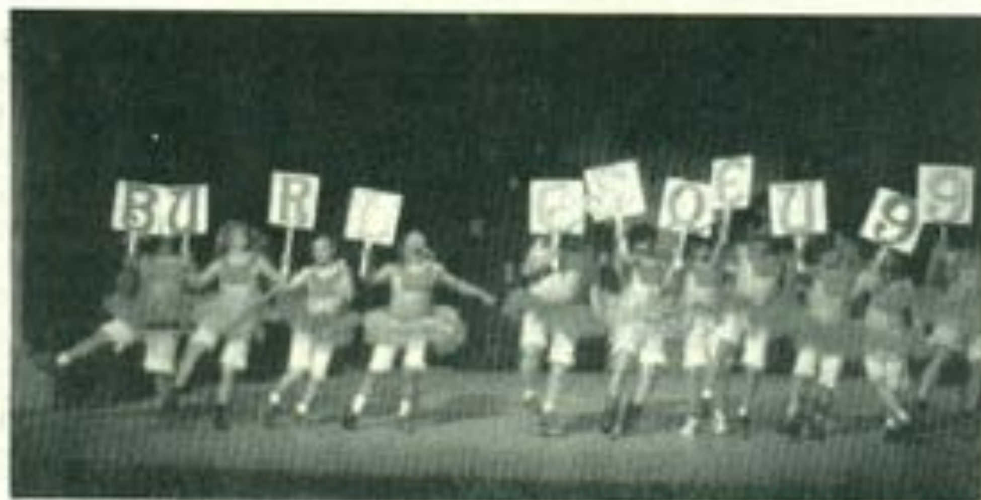
Bailable del burlesque en el año de 1999.

¿Entonces la contienda por la FEUD fue en 1997? ¿En qué mes?