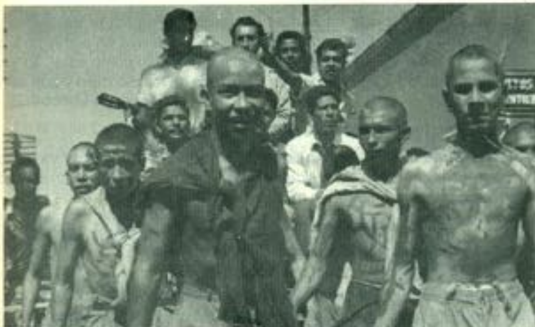
En las novatadas a los de nuevo ingreso se les rapaba y enchapopotaba