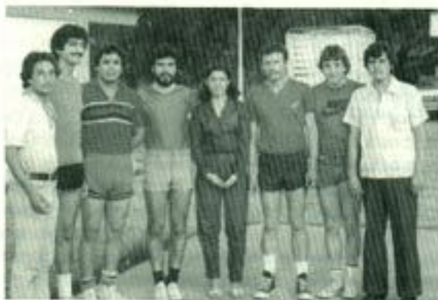
El Nuco, un gran aficionado al básquetbol.

conozcan la vida estudiantil de la Universidad, sino que nos va a permitir a nosotros como ex dirigentes dejar nuestra propia historia, nuestra huella.