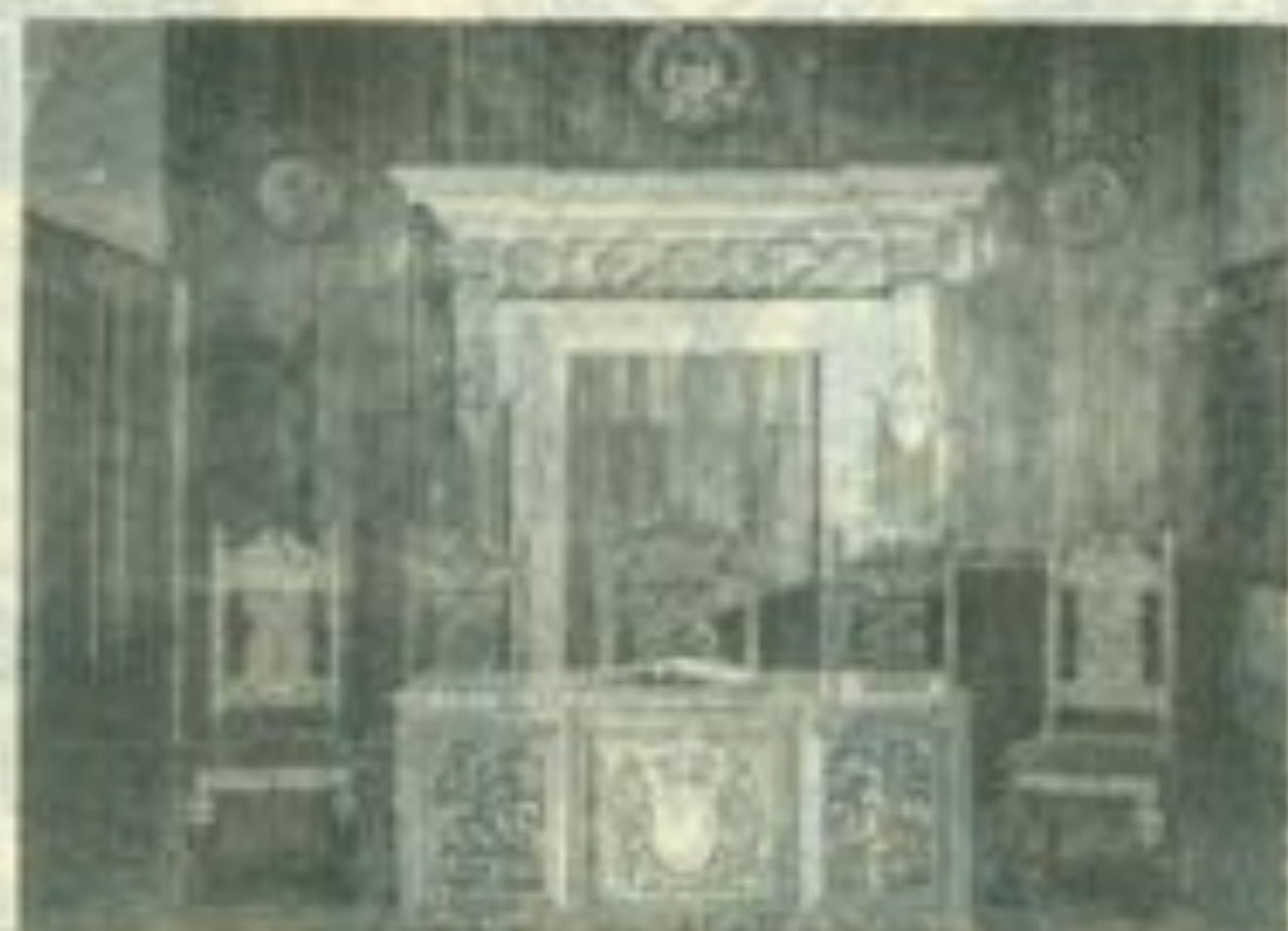
Memorable Aula Laureano Roncal que evoca las viejas glorias de eventos culturales y reuniones del Consejo Universitario.