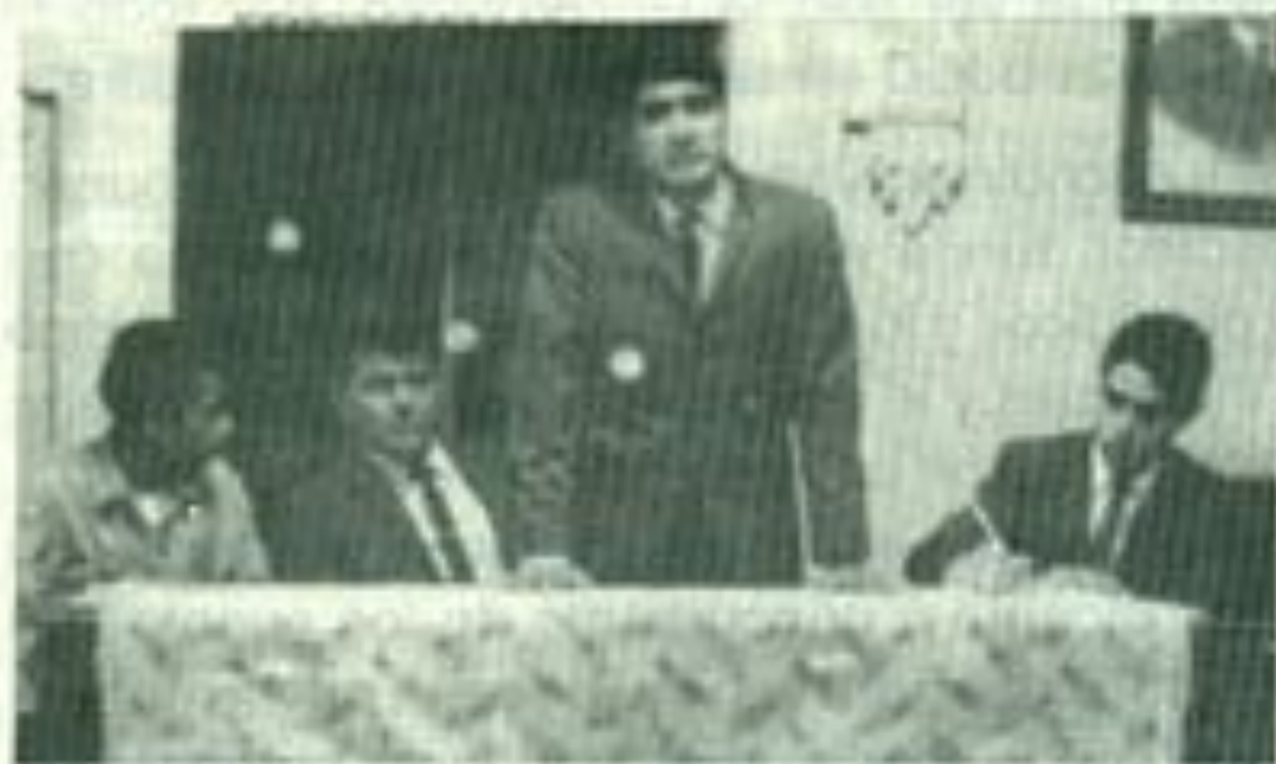
En el Aula Laureano Roncal, Reunión de la FEUD.