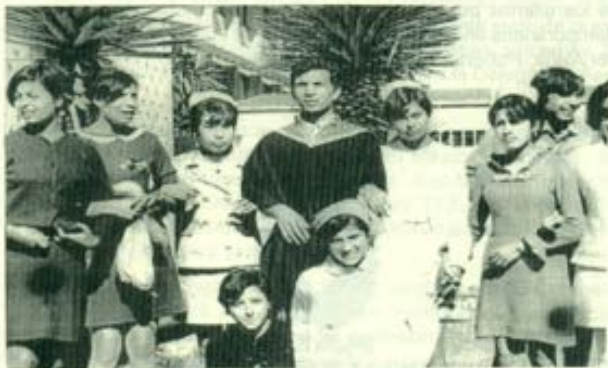
En la Escuela de Enfermería al conocer el triunfo de la FEUD.