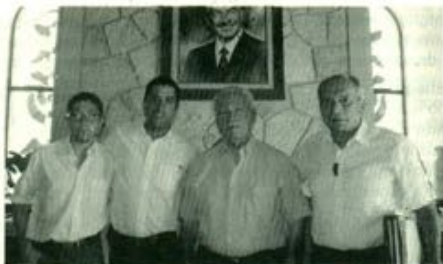
El ex gobernador de Durango Maximiliano Silerio después de una larga charla con el presidente de la FEUD José Ángel Mercado, el autor y Alonso Mancinas. Rememorando 50 años de liderazgos estudiantiles.

entrega de material escolar, electrónico, de todo tipo y está en operación un programa de bienvenidas deportivas en cada una de las escuelas.