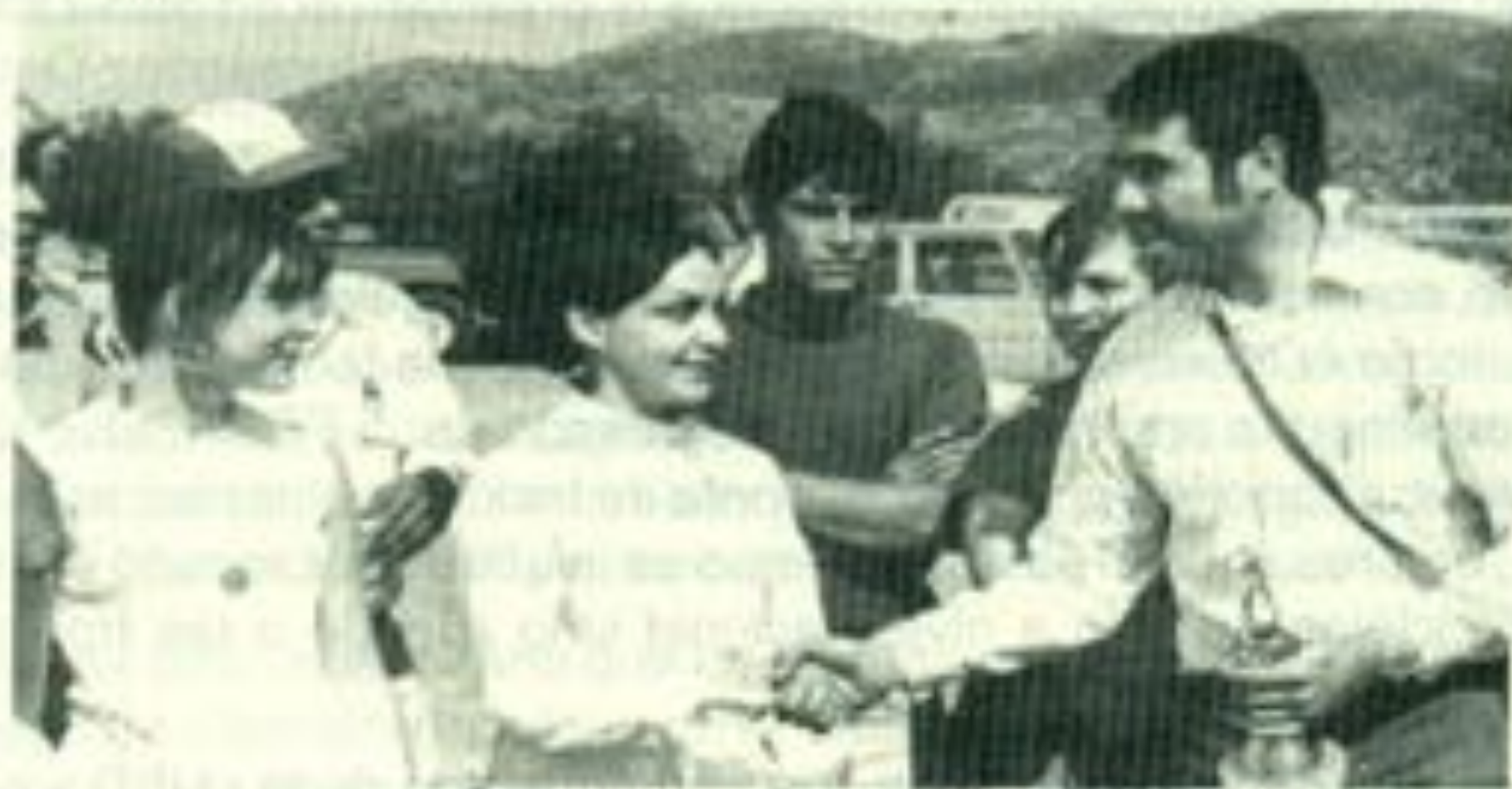
El equipo de fútbol de la preparatoria, obsequia el trofeo ganado al Presidente de la FEUD Moisés Moreno Armendáriz.