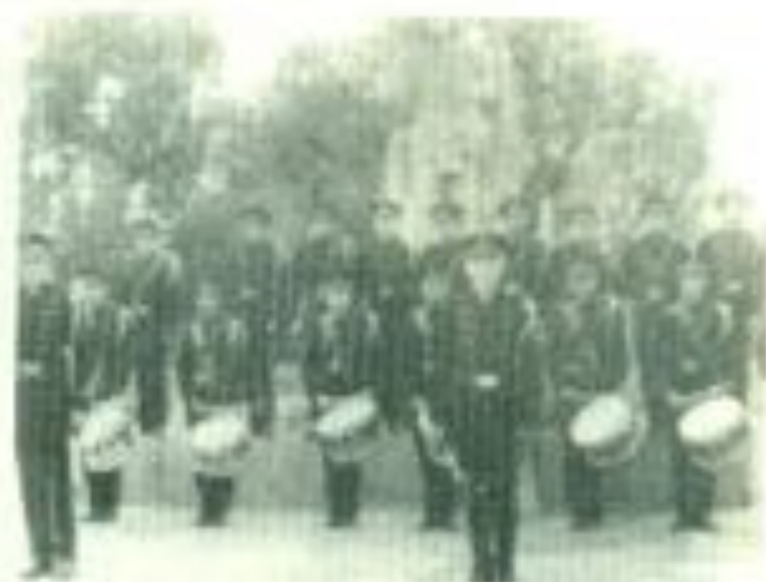
La Banda de Guerra de la Facultad de Derecho.