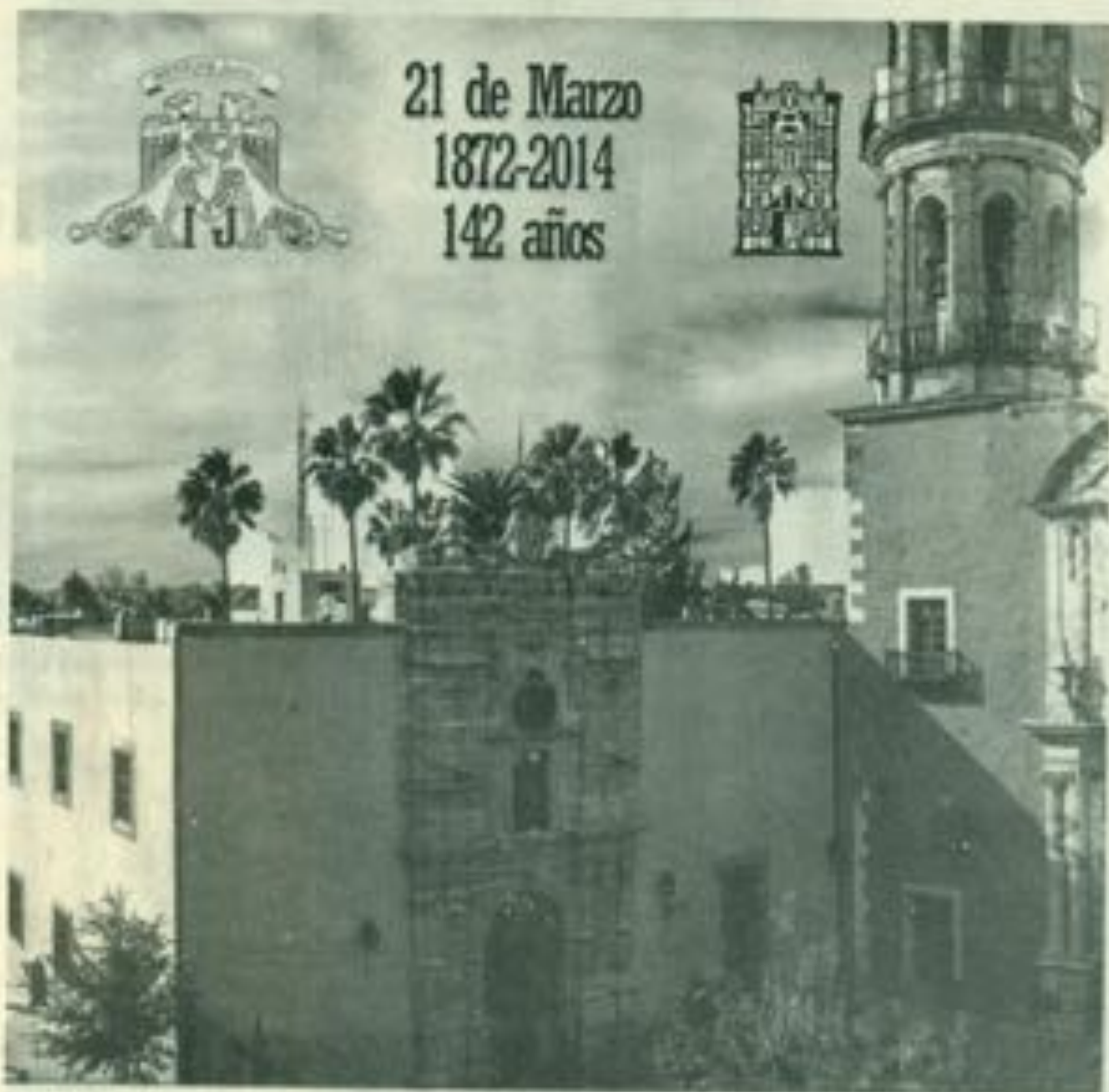
Gráfica tomada a perspectiva al Edificio Central de la UJED en el natalicio de Benito Juárez el 21 de Marzo del 2014.