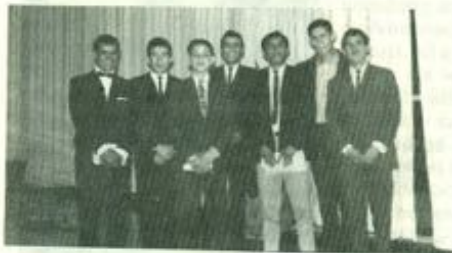
Finalistas de un concurso univer- sitario de oratoria.