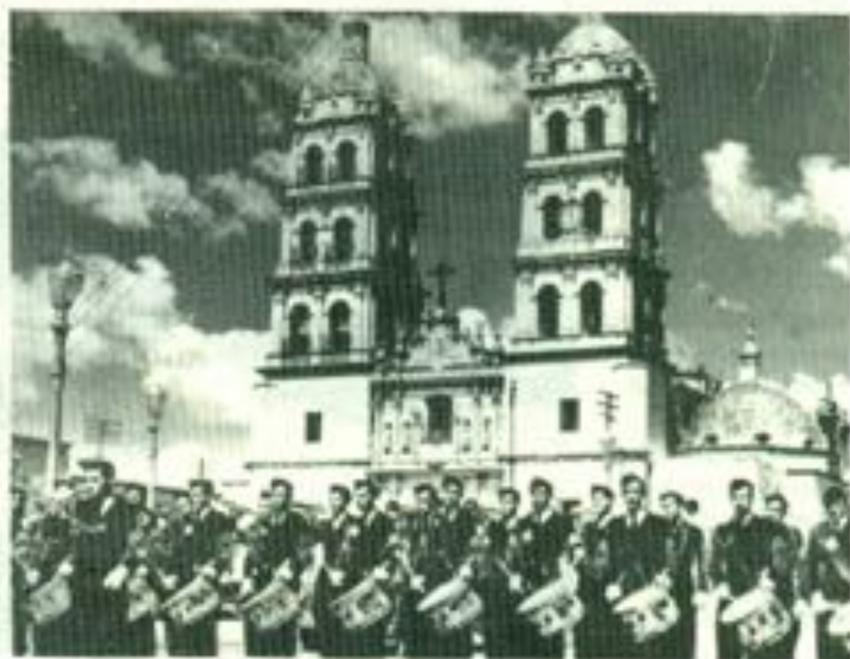
La Banda de Guerra, orgullo de la Universidad Juárez que ha cosechado triunfos a nivel nacional e internacional.