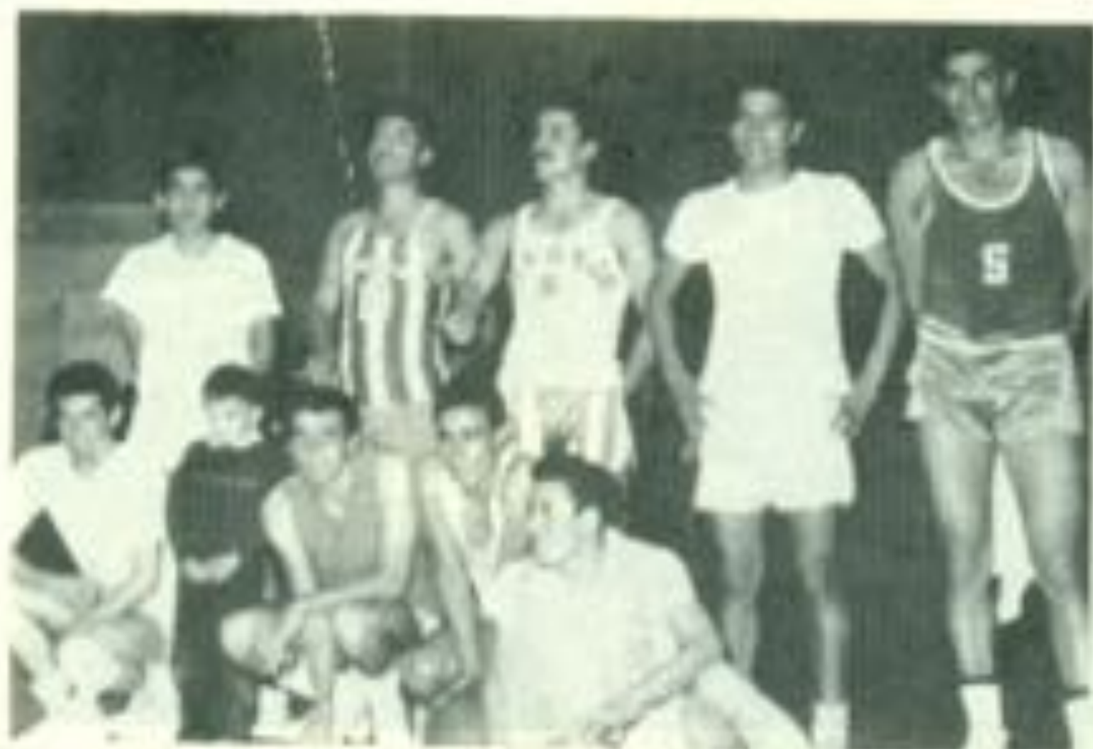
Parte del equipo de la Universidad integró la selección de Durango de basquetbol.